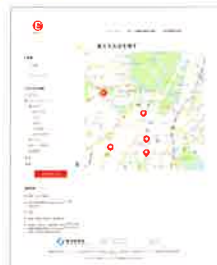
ポイント還元事業ホームページ