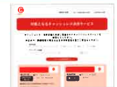
ポイント還元事業ホームページ